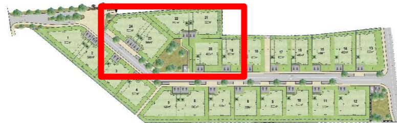
Plan de masse d'ensemble