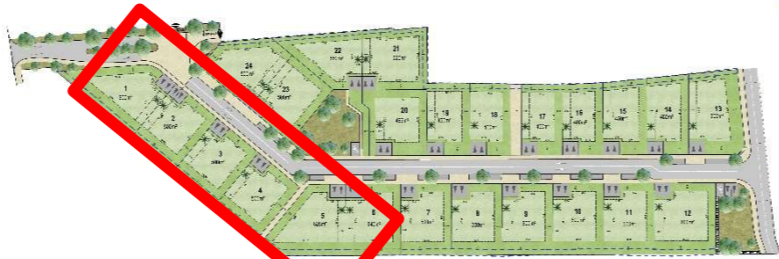
Plan de masse d'ensemble

Grille de prix valable jusqu'au 30/04/2024